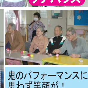
鬼のパフォーマンスに思わず笑顔が！