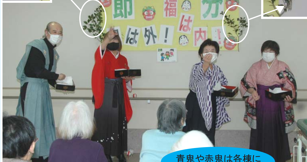
青鬼や赤鬼は各棟に引っ張りだこ