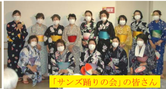
「サンズ踊りの会」の皆さん